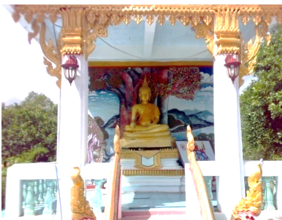
ภาพที่ ๓ พระพุทธรูปรั้งสีทรายทอง

พระพุทธรูปประจำโรงเรียน พระพุทธรั่งสีทรายทอง