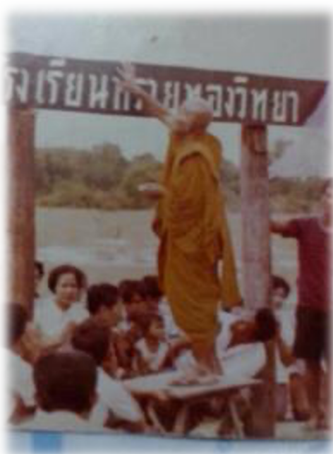
ภาพที่ ๑ วันสถาปนาโรงเรียนทวายทองวิทยา