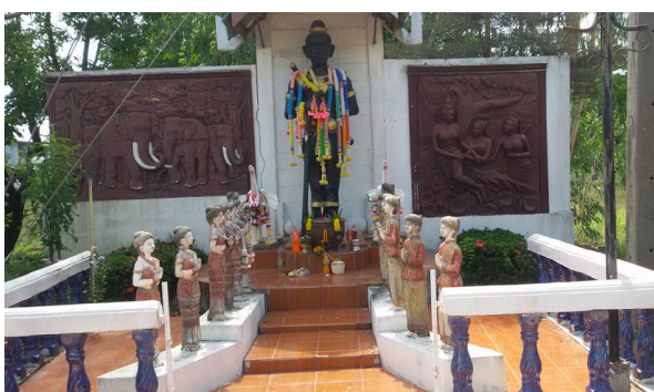
ภาพที่ ๒ รูปปั้นท้าวคันธนาม

พระพุทธรูปประจำโรงเรียน พระพุทธรั่งสีทรายทอง